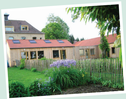
Éco-Gîte adapté aux personnes en situation de Handicap