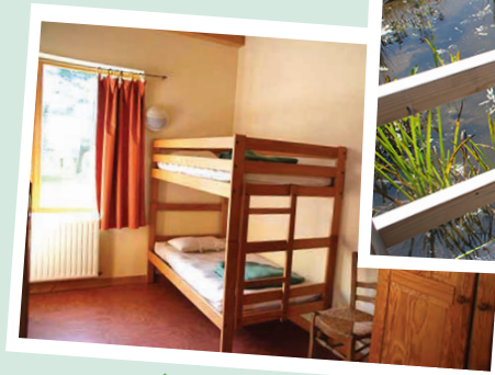
dortoirs + infirmerie