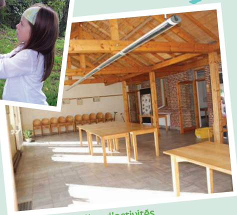
2 salles d'activités